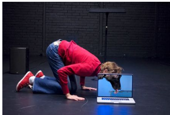
1 : Our Daily Performance